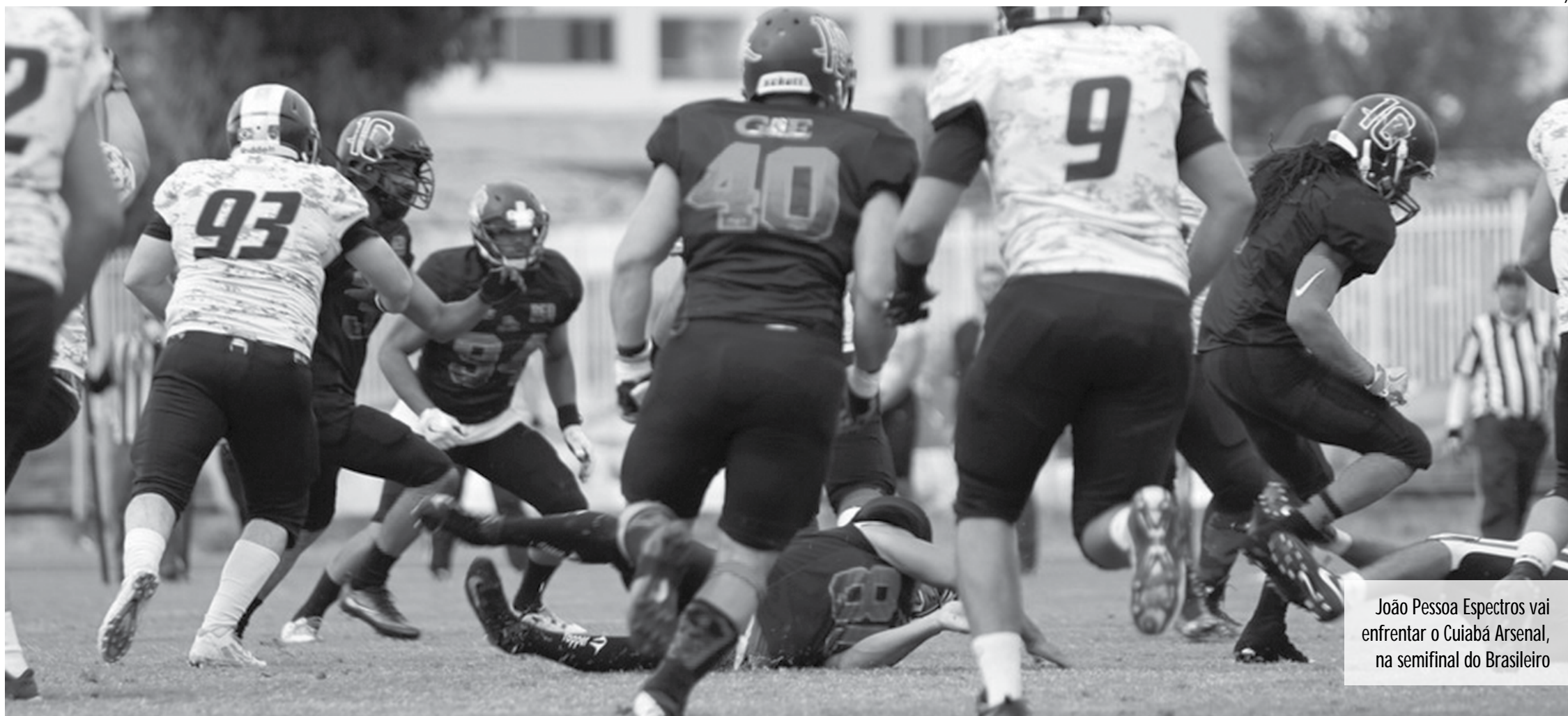
João Pessoa Espectros vai enfrentar o Cuiabá Arsenal, na semifinal do Brasileiro