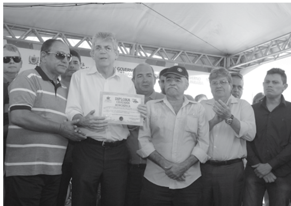
Durante a solenidade, o governador Ricardo Coutinho, recebeu o título de cidadão ingaense

"Eu jamais esquecerei o gesto da Câmara Municipal de Ingá. Para mim, não é receber só um diploma. É tomar uma dose de corresponsabilidade e de respeito, presente e futuro com o povo de Ingá, eu quero agradecer a todos por esse gesto", agradeceu Ricardo.