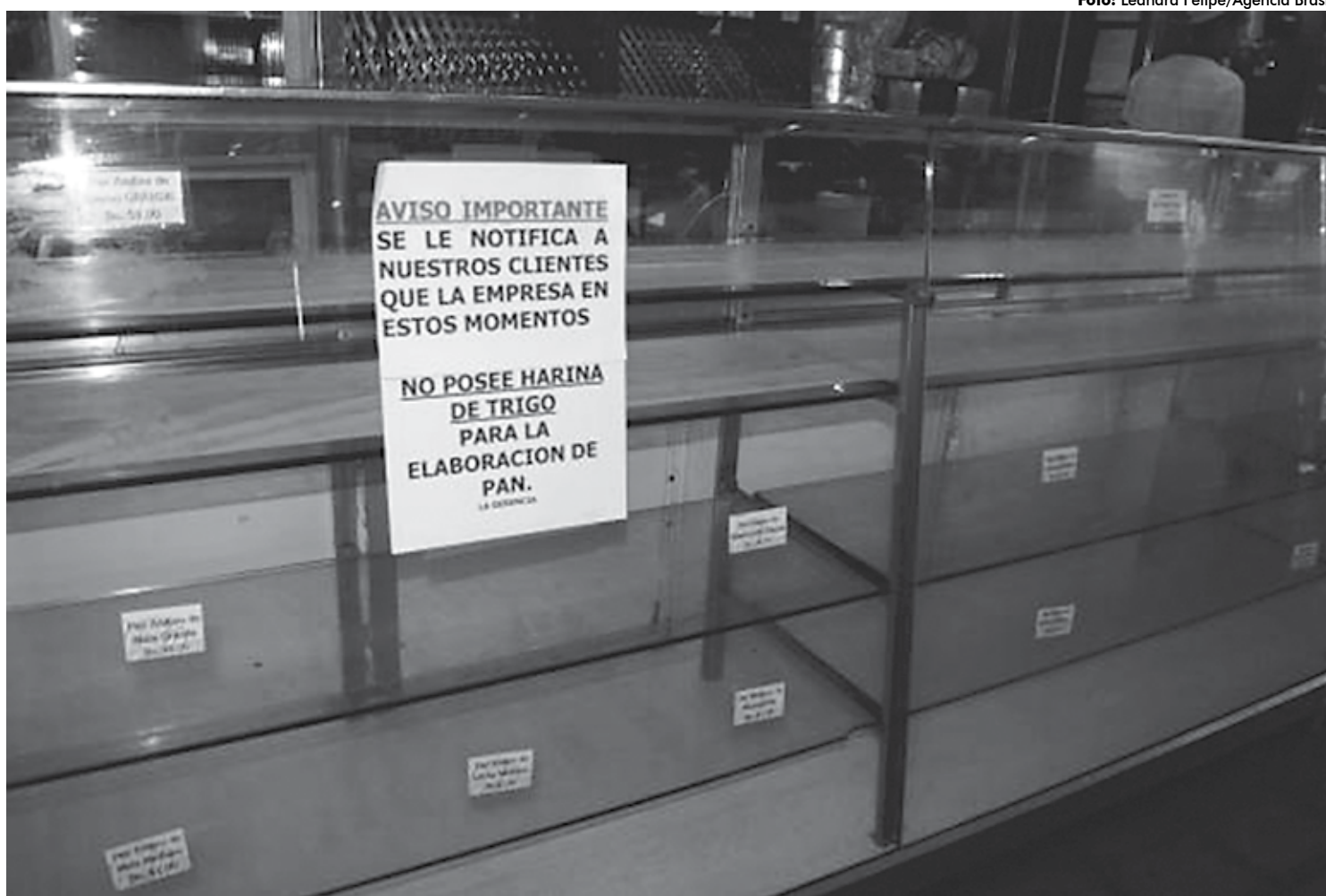
Além da escassez de cédulas, a Venezuela enfrenta também falta de alimentos e produtos em geral nos supermercados, com a inflação mais alta do mundo