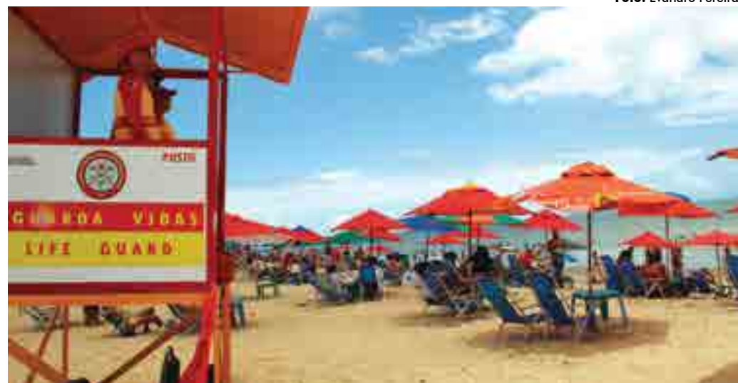
Grupos de militares em postos de salva-vidas fiscalizam e orientam os banhistas sobre segurança no mar